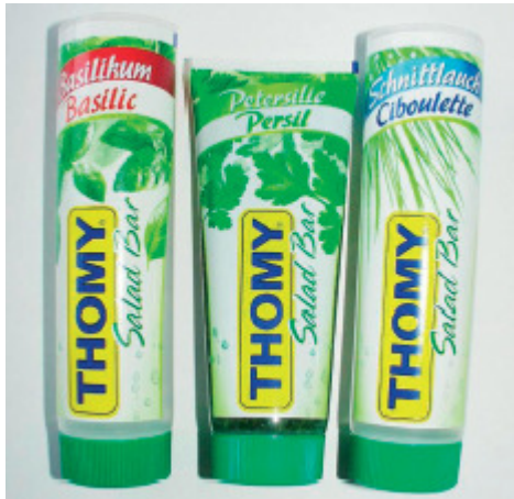
Produktbeispiel Form und Design made by TUBEX